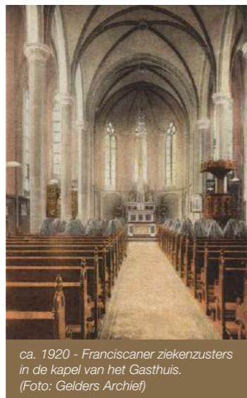
ca. 1920 - Franciscaner ziekenzusters in de kapel van het Gasthuis.

De kapel wordt rijk versierd met kleurige tegelvoeren, tien glas-in-loodramen, wandschilderingen en pilaren van kostbaar grijs graniet. De imposante toegangsdeur aan de Zwarteweg is voorzien van prachtig smeedwerk. Het St. Elisabeths Gasthuis groeit in de loop der jaren uit tot een groot en modern ziekenhuis, maar behoudt zijn religieuze karakter. De kapel speelt daarbij een belangrijke rol, zelfs tijdens de Slag om Arnhem in 1944, wanneer het ziekenhuis dienstdoet als legerhospitaal.