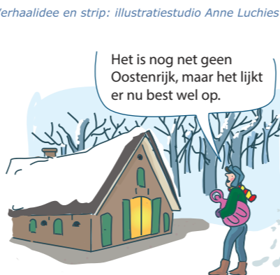
en na al die winterpret: Tijd voor een après-ski in de Hoeve.