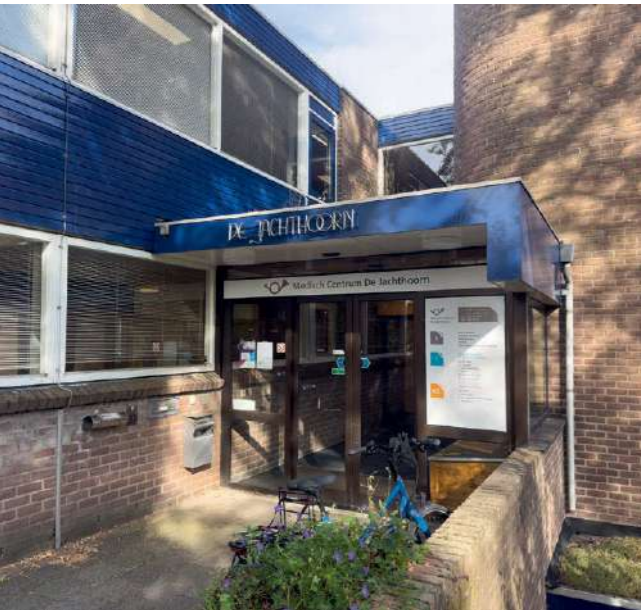
Medisch centrum De Jachthoorn in Het Dorp