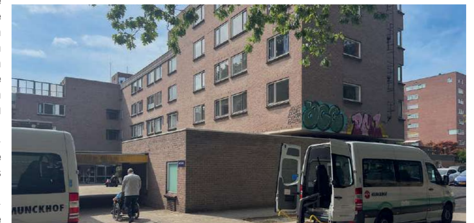
Veel gebouwen in Het Dorp zijn gesloopt en de gebouwen die er nog staan, zijn verouderd. Sommige ruimtes staan leeg, andere worden gebruikt voor huisvesting van mensen met een beperking en zorgverleners.

Uit: De Penseelstreek , herfstnummer 2025, wijkkrant van Hoogkamp, Sterrenberg, Gulden Bodem