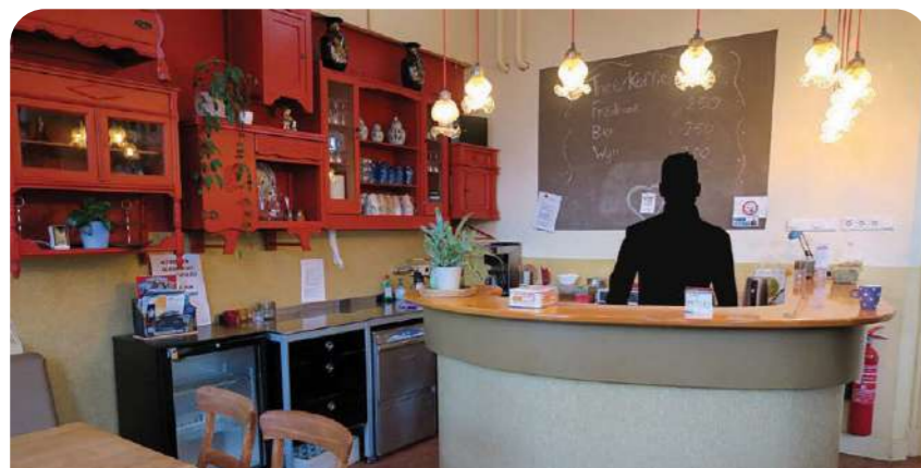
Help jij binnenkort een keer mee achter de bar?