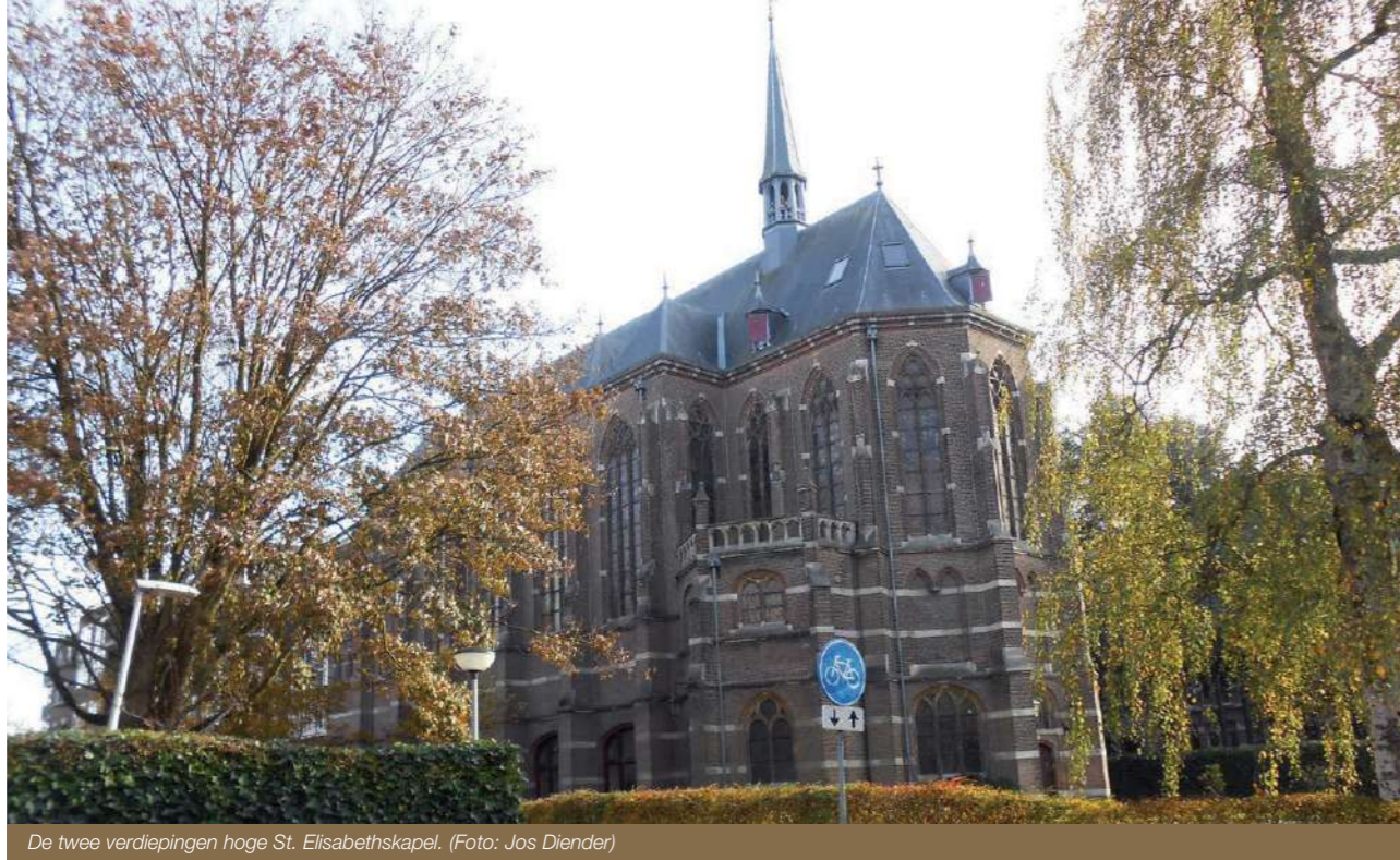
De twee verdiepingen hoge St. Elisabethskapel.