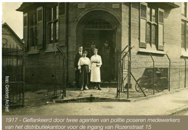
1917 - Geflankeerd door twee agenten van politie poseren medewerkers van het distributiekantoor voor de ingang van Rozenstraat 15

Geen vreemde gedachte. Het is indertijd ontworpen in opdracht van de Gereformeerde Kerk Arnhem. Niet als kerk, maar als evangelisatiegebouw om de jeugd van Heijenoord en Lombok in aanraking te brengen met het geloof. Het gebouw kreeg dan ook de toepasselijke naam 'De Goede Tijding'.