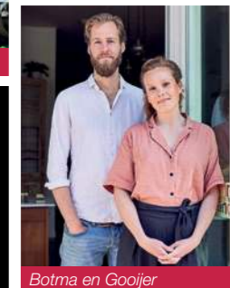
Botma en Gooijer