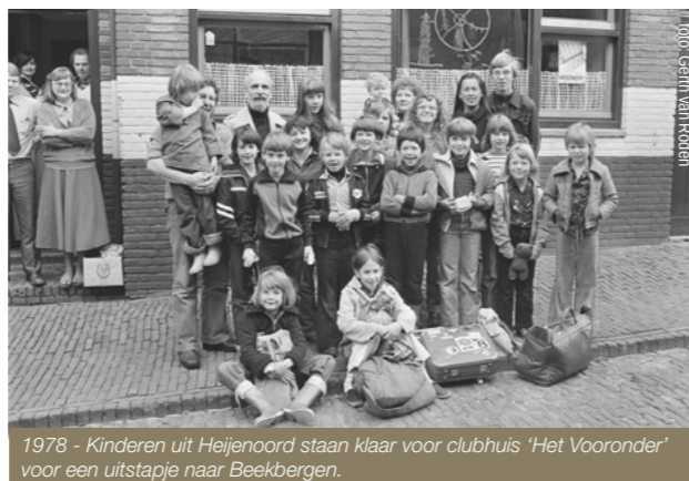
1978 - Kinderen uit Heijenoord staan klaar voor clubhuis 'Het Vooronder' voor een uitstapje naar Beekbergen.

Twee jaar later kreeg het pand een uitbouw ('Het Vooronder') met onder andere een timmerlokaal voor jongens, een keuken en kantoor. De grote zaal werd uitgebreid met een podium. Naast de wekelijkse club-activiteiten werd hier iedere zaterdagavond een instuif voor de jeugd georganiseerd.