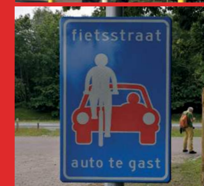
Voorbeelden van een verkeersbord voor flexibele afsluiting en auto te gast.