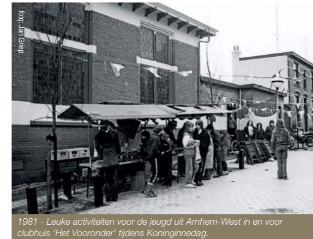
1981 - Leuke activiteiten voor de jeugd uit Arnhem-West in en voor clubhuis 'Het Vooronder' tijdens Koninginnedag.

Halverwege de jaren '80 nam stichting Rijnstad de jeugd- en jongerenactiviteiten van 'Het Jeugdthonk' over. Tijdens een drastische verbouwing gingen vrijwel alle authentieke elementen van het gebouw verloren. Zo kreeg de grote zaal een verdiepingsvloer, werden bijna alle neo-romaanse boogramen vervangen door grote vensters en verdwenen de muren achter voorzetwanden.